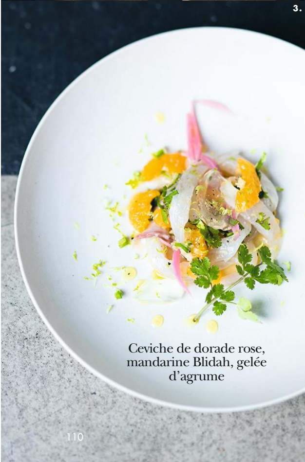
Ceviche de dorade rose, mandarine Blidah, gelée d'agrumes