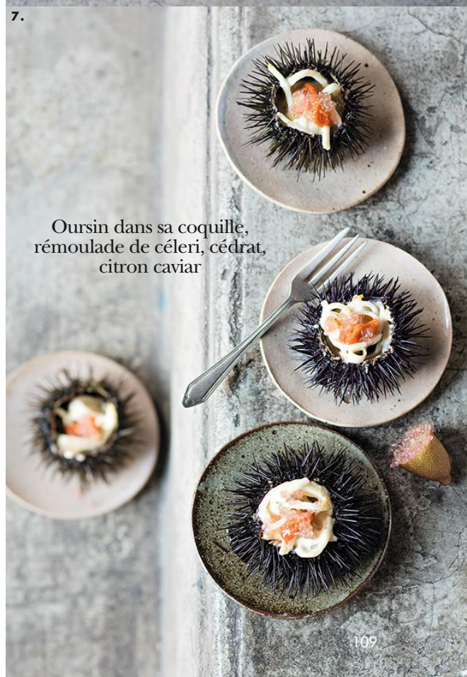
Oursin dans sa coquille, rémoulade de céleri, cédrat, citron caviar