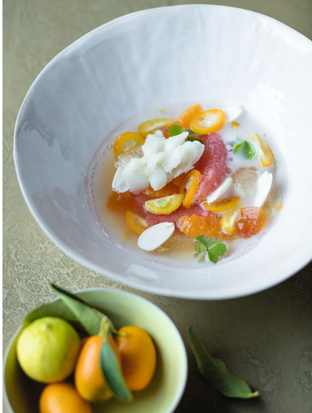
Nage d'agrumes au champagne, sorbet fenouil sauvage