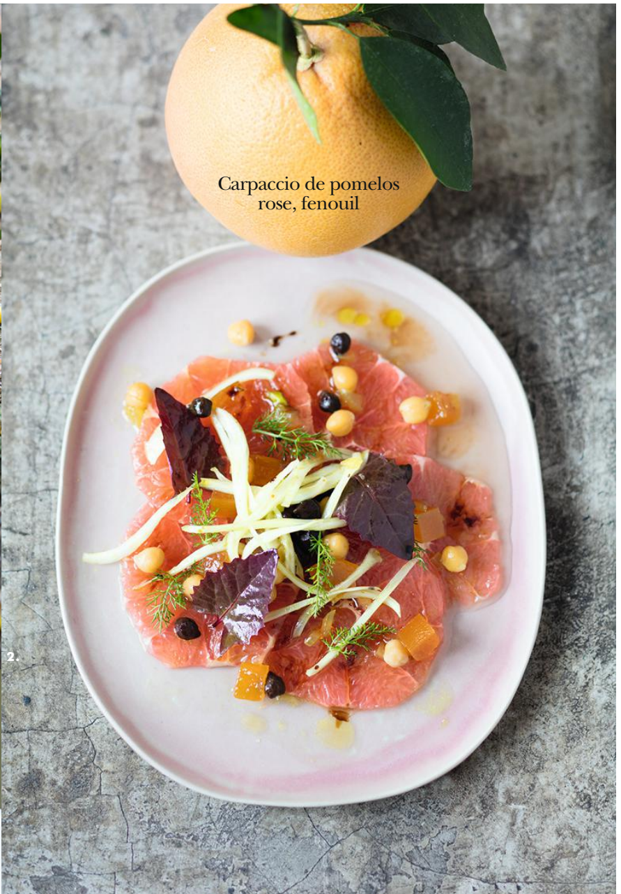
Carpaccio de pomelos rose, fenouil