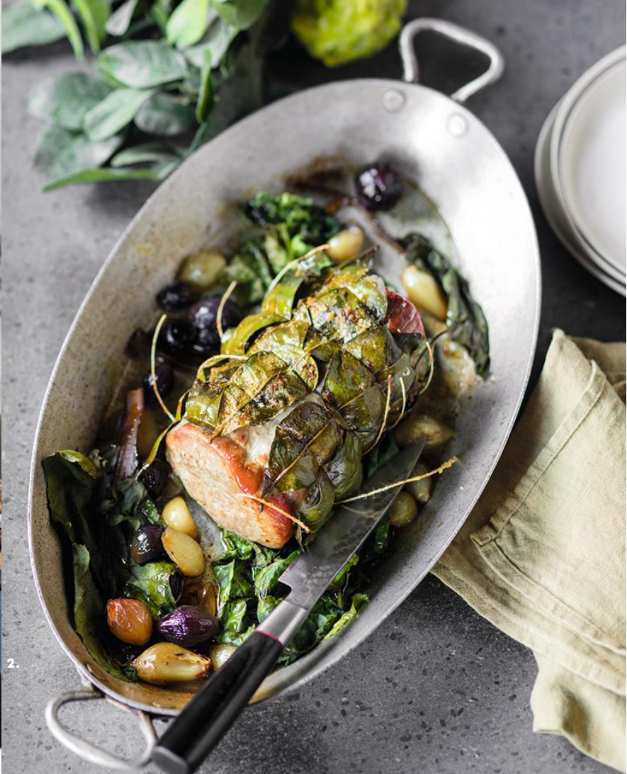
Quasi de veau rôti en feuille de combawa