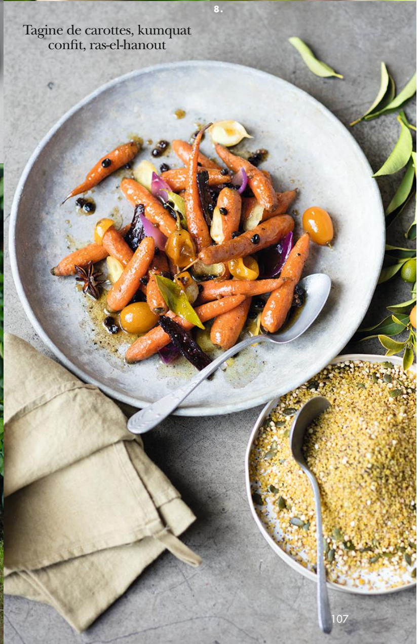
Tagine de carottes, kumquat confit, ras-el-hanout