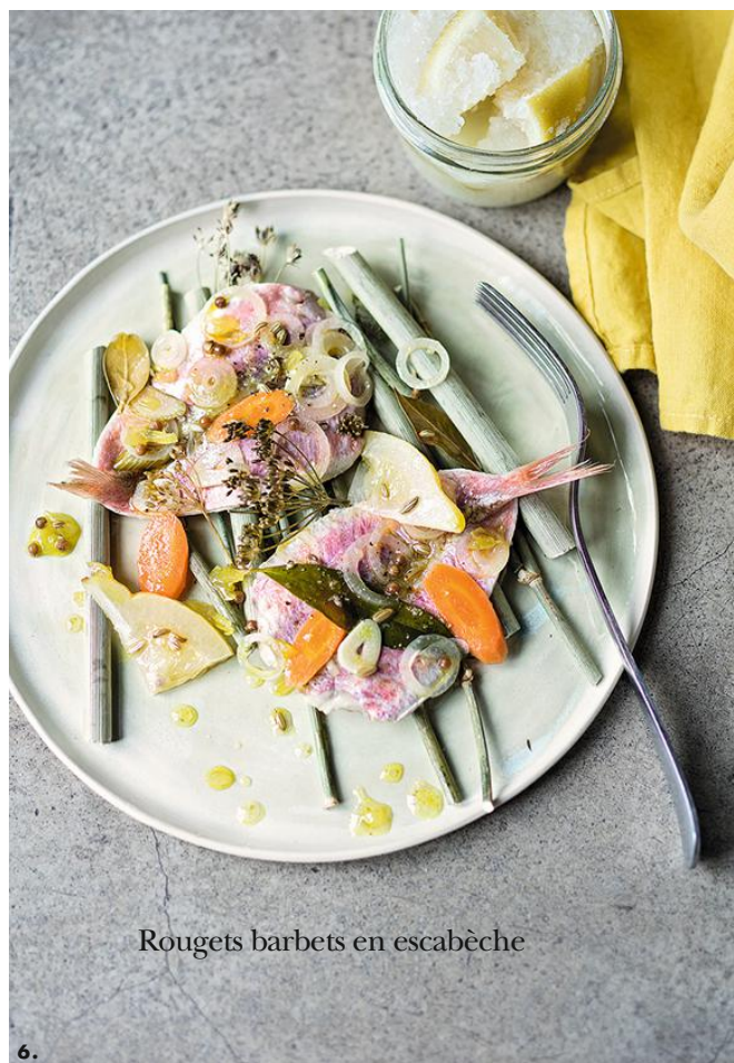
Rougets barbets en escabèche