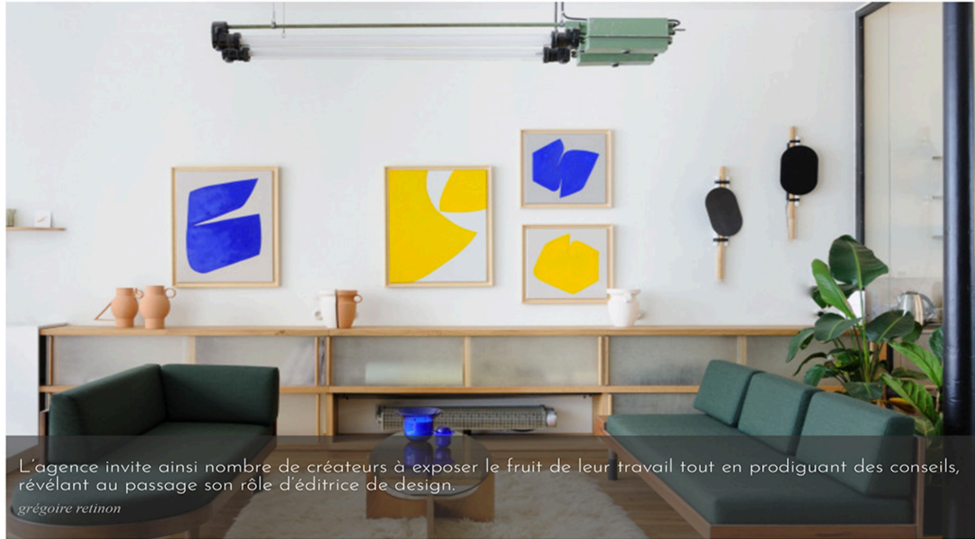
L'agence invite ainsi nombre de créateurs à exposer le fruit de leur travail tout en prodiguant des conseils, régalant au passage son rôle d'éditeur de design. gégé@reimmon